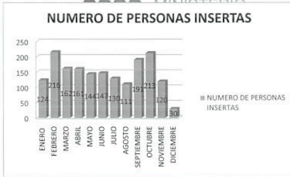
GRÁFICO 5: RED SOCIOEMPLEO