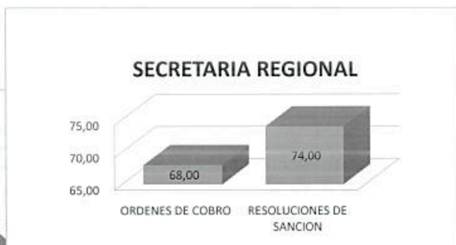
GRÁFICO 3: SECRETARIA REGIONAL