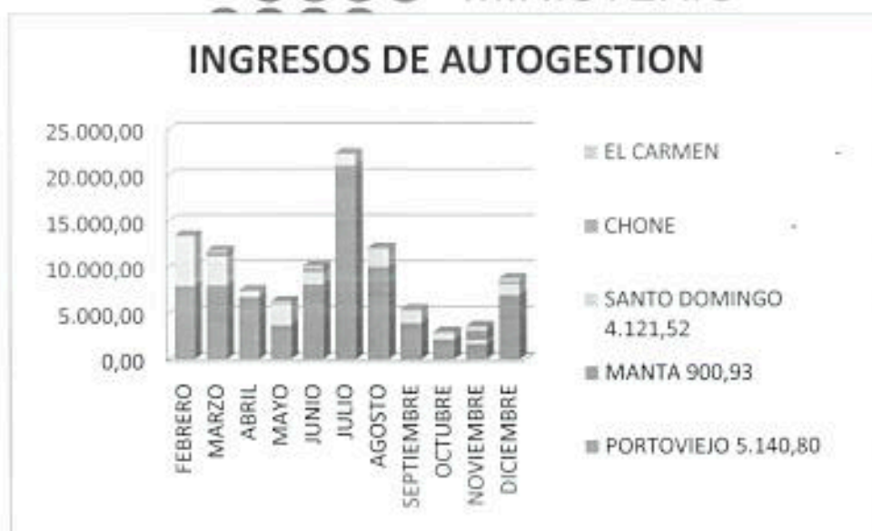
GRÁFICO 8: INGRESO AUTOGESTIÓN MINISTERIO