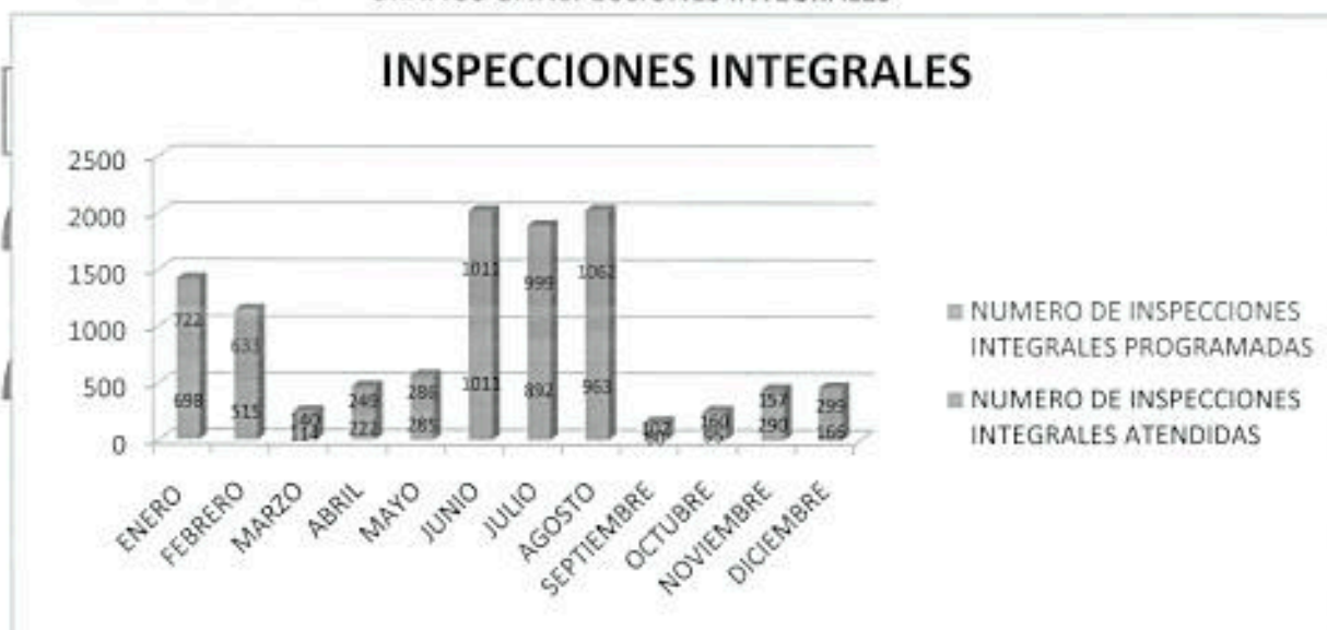
GRÁFICO 1: INSPECCIONES INTEGRALES