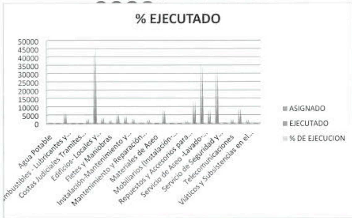
GRÁFICO 10: EJECUCIÓN DE GASTOS MINISTERIO