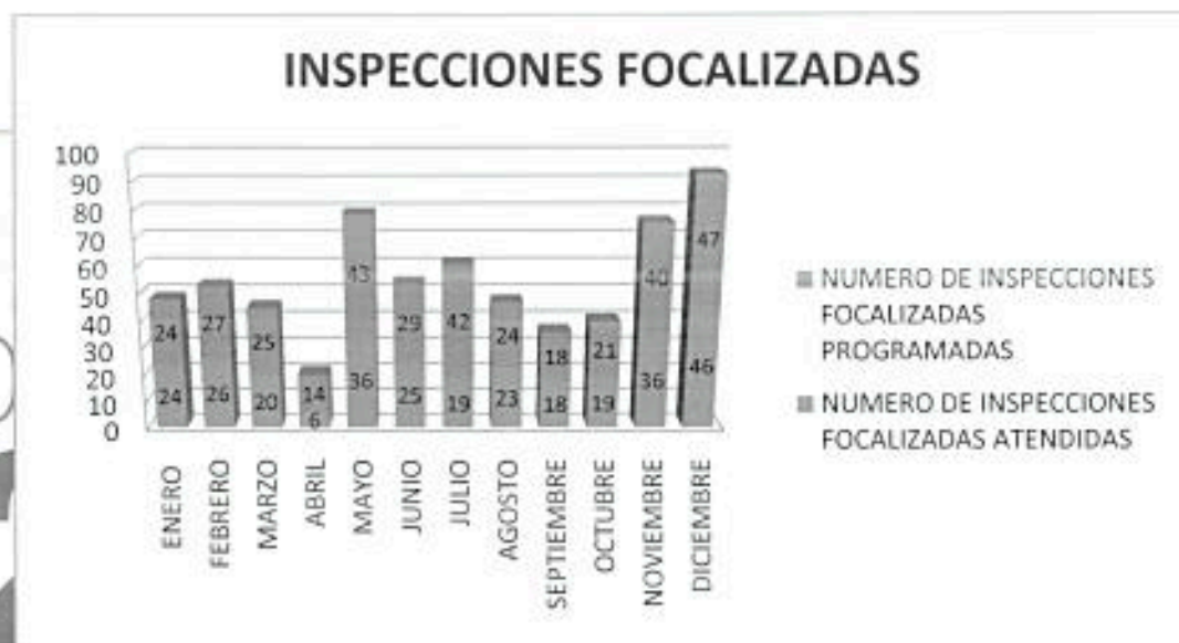
GRÁFICO 2: INSPECCIONES FOCALIZADAS