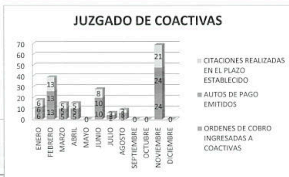
GRÁFICO 4: JUZGADO DE COACTIVAS