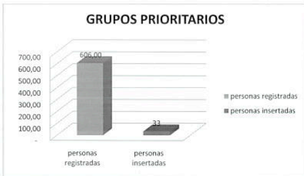
GRÁFICO 6: GRUPOS PRIORITARIOS